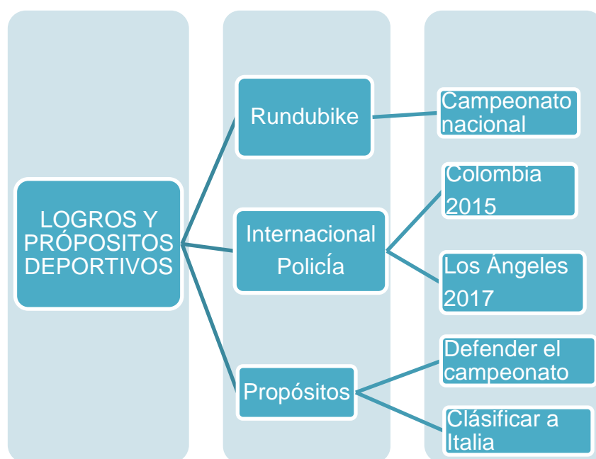
Gráfica 3. Categoría Logros deportivos. Fuente: Realización personal 2019.