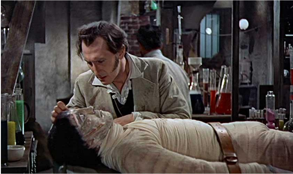
Figura No. 3. Fotografía película Frankenstein.