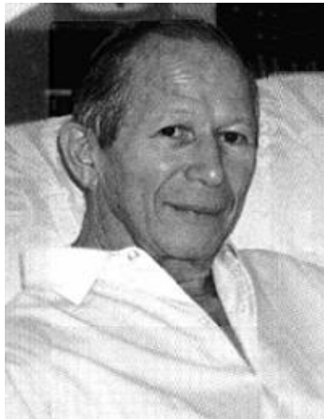
Figura No. 19. Fotografía James Bernard. Fuente: http:// http://eric.b.olsen.tripod.co

El uso de registros graves progresivos en las cuerdas, disonancias misteriosas, golpes de percusión e instrumentos poco usados hasta ese entonces (címbalo húngaro, instrumentos de percusión orientales, etc.) produjo partituras únicas y novedosas que hicieron que estas obras fueran consideradas como piezas fundamentales de la música de los films de terror.