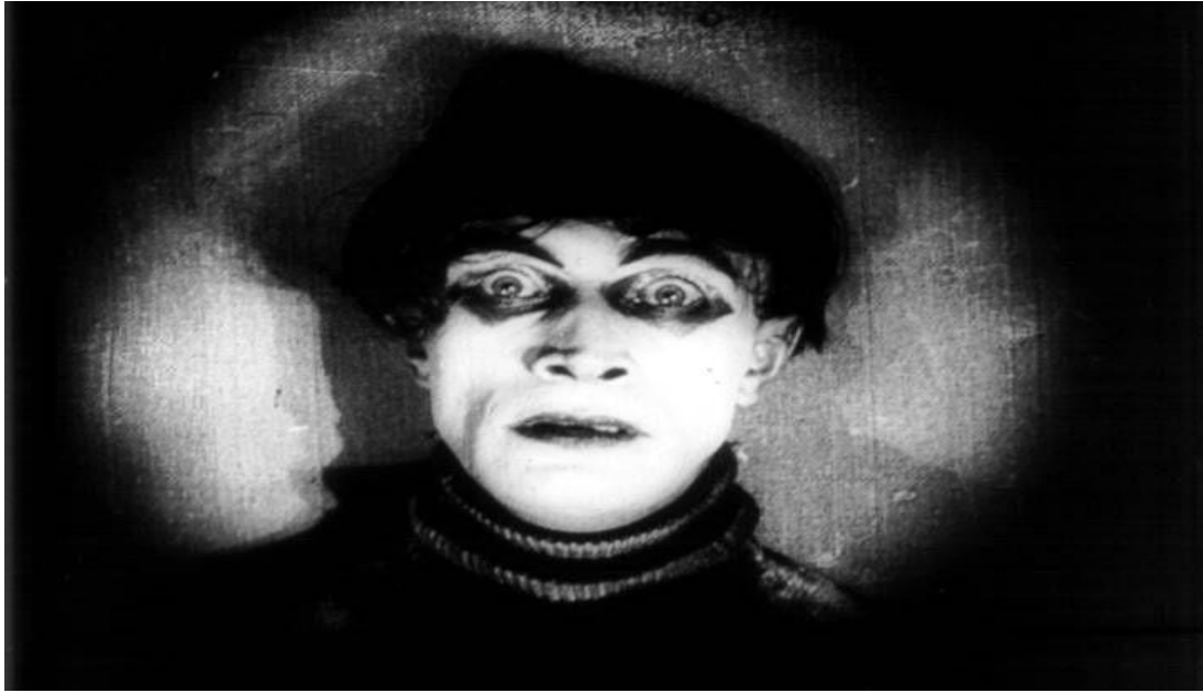
Figura No. 1. Maquillaje de El Gabinete del Doctor Caligari .