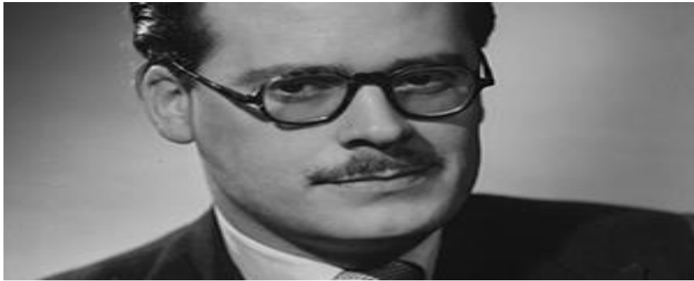
Figura No. 10. Fotografía Anthony Hinds . Fuente: http:// theguardian.com/

“En Estados Unidos de Norteamérica este es un género que ha tenido alzas y bajas. Empezó en la década de los 30’s con películas góticas y de serie B. Recuérdese que ese país tuvo una fuerte crisis económica en 1929. Luego el género retoma fuerza hacia finales de los 50’s e inicios de los 60’s gracias a dos compañías cinematográficas: Hammer Films Productions y American International Pictures 21 (AIP). Estas casas realizadoras se enfocaron en criaturas como Drácula, Frankenstein y el Hombre Lobo. Sus escenarios continúan siendo espacios oscuros, góticos y remotos. A partir de este momento se dirige la mirada hacia el público adolescente como objetivo. Es posible que se haya buscado generar una analogía entre las criaturas protagonistas de estas películas con una capacidad de mutar o de modificar, característica fundamental durante la adolescencia” (Cano, 2010, p.40)