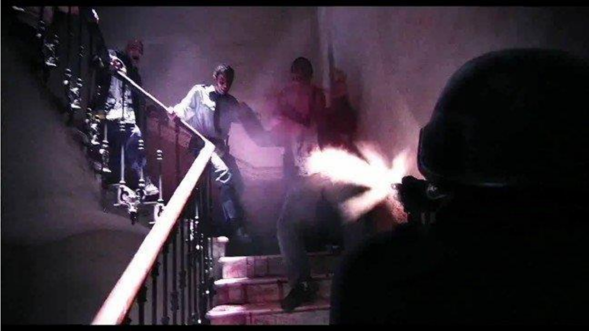
Figura No. 8. Fotografía película Rec.