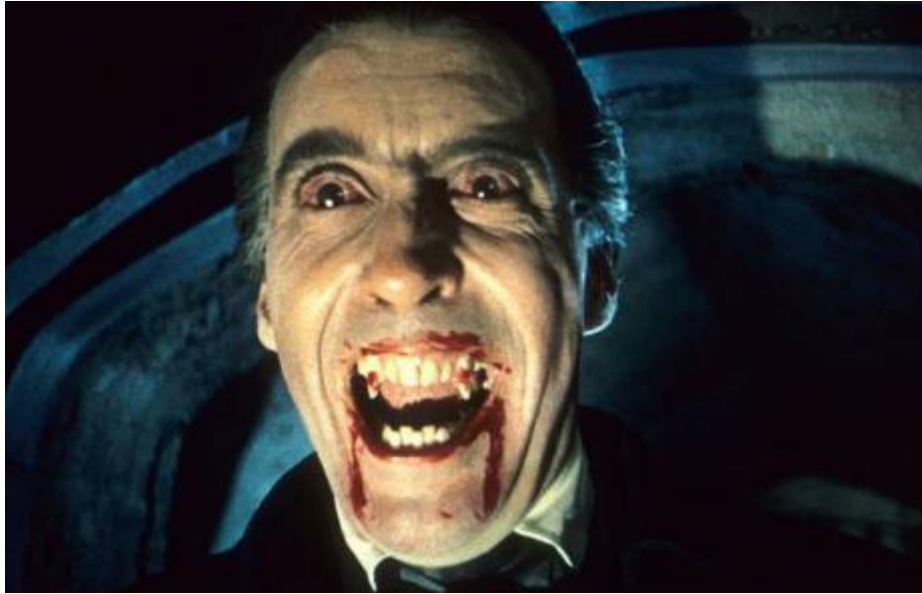
Figura No. 13. Fotografía Christopher Lee Dracula.