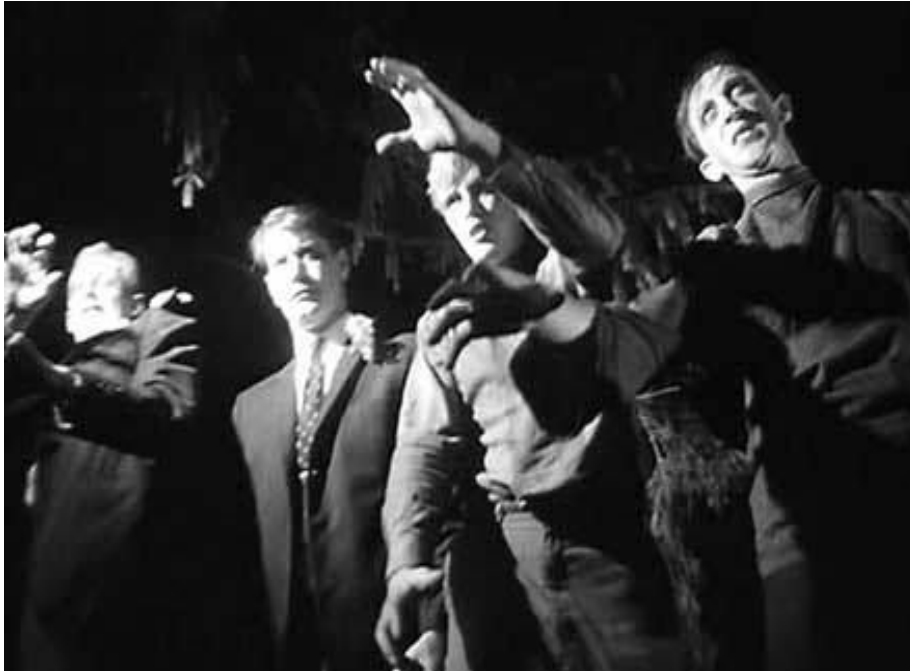
Figura No. 4. Caminata La Noche de los Muertos Vivientes.

directores insólitos: Michael Reeves de Los brujos (1967) y Witchfinder General (1968); Roman Polanski de El baile de los vampiros (1967) y La semilla del Diablo (1968) y H.G. Lewis de Blood Feast (1963), pistoletazo de salida del gore y posibilitadora de delirios como The Ghastly Ones (1968), obra de Andy Milligan.