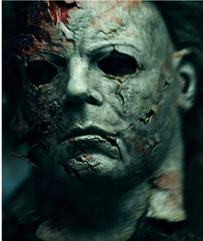
Figura No. 6. Fotografía película Halloween.