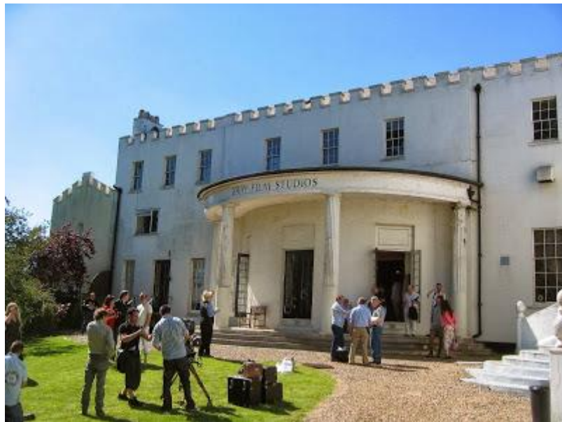
Figura No. 12.