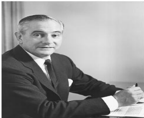
Figura No. 11. Fotografía James Carreras . Fuente: http:// filmreference.com/