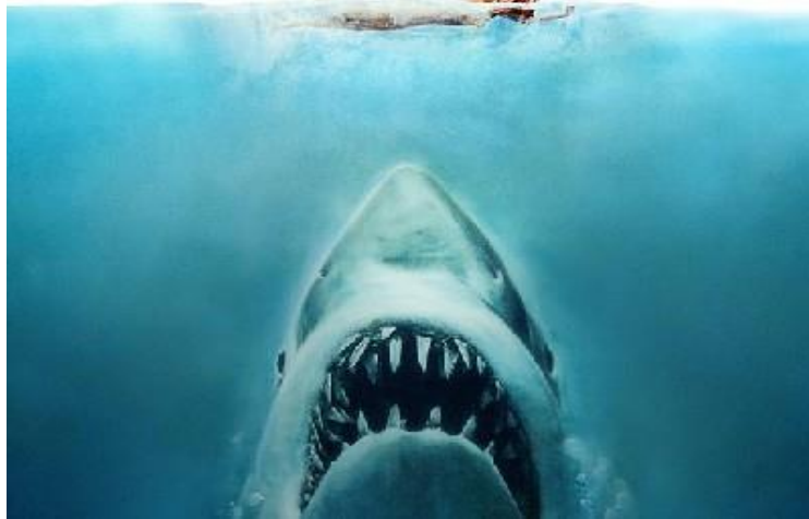
Figura No. 16. Imagen tiburón.