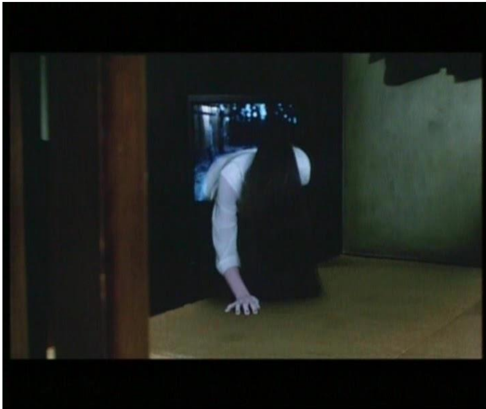
Figura No. 7. Fotografía película Ringu.

prefirió apostar por los juegos cerebrales con de Cube (1997) o Scream (1996), unión entre el viejo Craven y la nueva sangre el guionista Kevin Williamson. El impacto en las salas tuvo un efecto colateral: el regreso del denominado slasher, con Sé lo que hicisteis el último verano (1997) y Leyenda urbana (1998) como máximos exponentes. Japón en cambio se dedicó a hacer homenajes y metalenguajes, prefiriendo marcar el camino de la siguiente década con Ringu (1998) (Kemp, 2011).