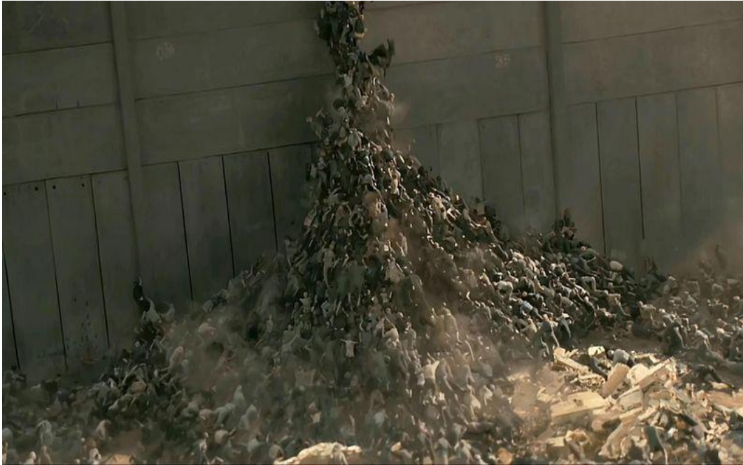
Figura No. 9. Fotografía película Guerra Mundial Z.

propuestas más interesantes, con una única excepción llamado James Wan, responsable de Insidious (2011), Insidious 2 y El Conjuero (2013), a la que le ha salido un spin-off titulado Annabelle (2014) (Noel, 2011) .