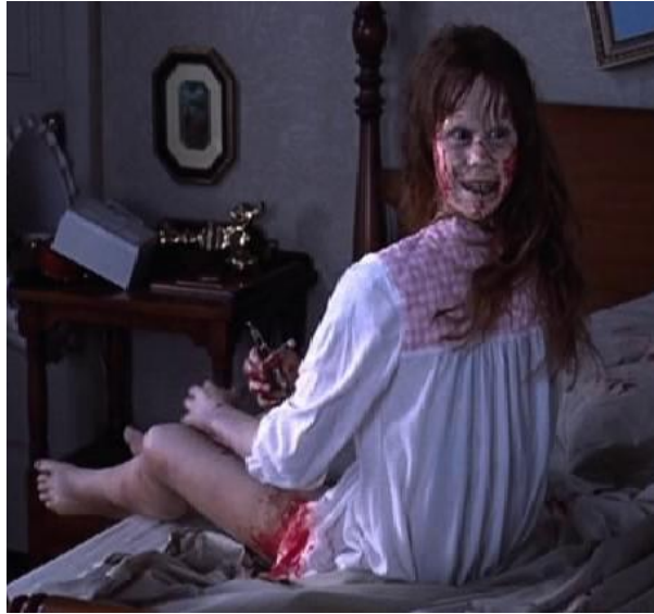
Figura No. 18. Fotografía El Exorcista.