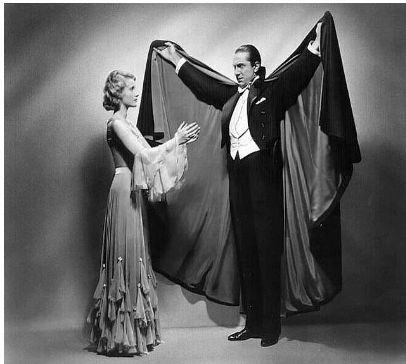
Figura No. 2. Dracula.

difíciles. Además, estas mismas películas crearon una caligrafía del horror de la que el género sigue dependiendo hasta el día de hoy. El estudio que los vio nacer, Universal, dominó el resto de la década sin demasiadas complicaciones: 'La momia', 'El caserón de las sombras' (ambas de 1932), 'El hombre invisible' (1933) y 'La novia de Frankenstein' (1935) son algunas joyas que este estudio tuvo durante la época. Otros estudios intentaron plantarle cara, pero sólo 'Los crímenes del museo de cera' (1933) y 'El hombre y el monstruo' (1931), innovadora adaptación del mito de Jekyll y Hyde, se acercaron.