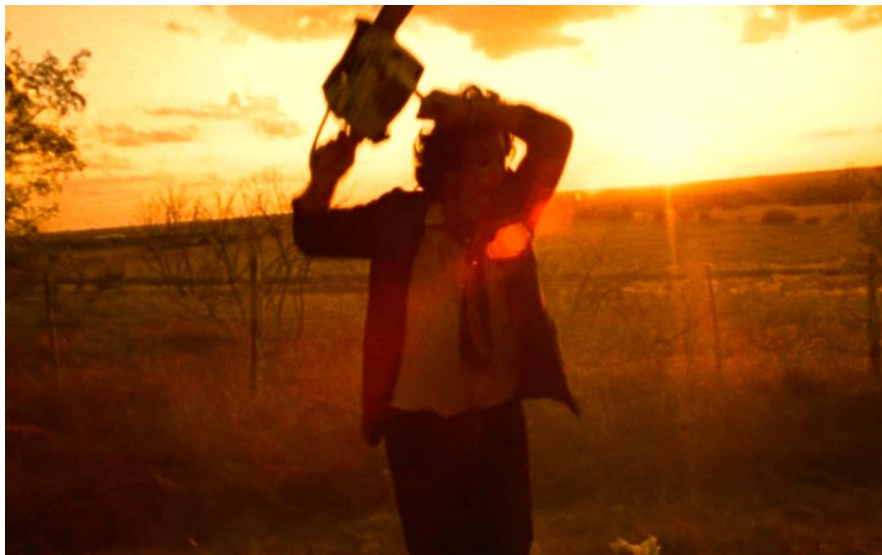
Figura No. 5. Fotografía película La matanza de Texas.

Esta también es la década de blockbusters de prestigio como El exorcista (1973) o La profecía (1976). Estoy vivo (1974) compartía la misma concepción de la infancia que la película de Richard Donner, pero Carrie (1976) demostró que la adolescencia tampoco era mucho mejor. En España, el terror tocó el cielo en 1974 con: No profanar el sueño de los muertos y ¿Quién puede matar a un niño?. Esta década termina con dos joyas excéntricas en el 77: Suspiria o La Sinfonía de terror onírico del maestro Argento; y Hausu que es una película japonesa que debe ser vista para poder ser creída (Noel, 2014).