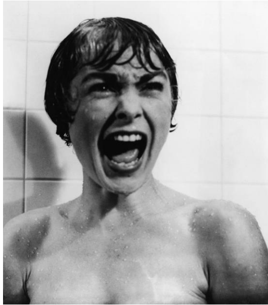
Figura No. 17. Fotografía Psycho.