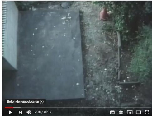
Imagen N°4. Embracing. Naomi Kawase (1992)