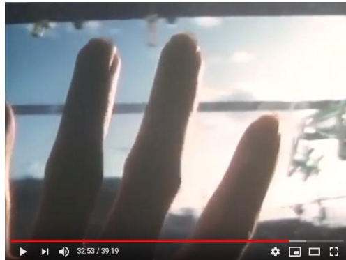
Imagen N°7. Katatsumori. Naomi Kawase (1994)