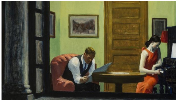
Imagen No. 2. Habitación en New York, Edward Hopper. (1932)