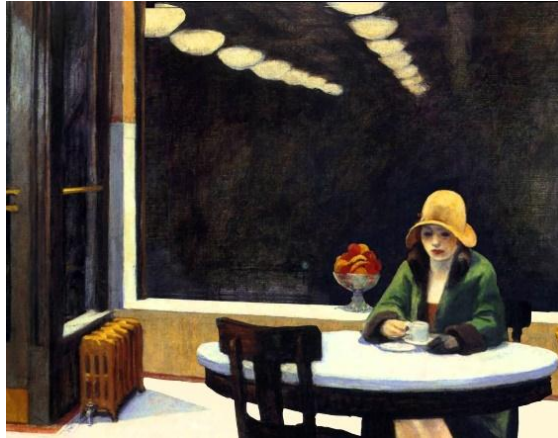
Imagen No.1 La autómata, Edward Hopper. (1927)