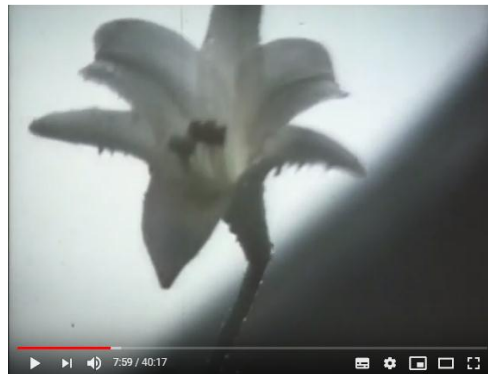
Imagen N°5. Embracing. Naomi Kawase (1992) fuente: captura de pantalla de youtube

Imagen N°4. Embracing. Naomi Kawase (1992) fuente: captura de pantalla de youtube