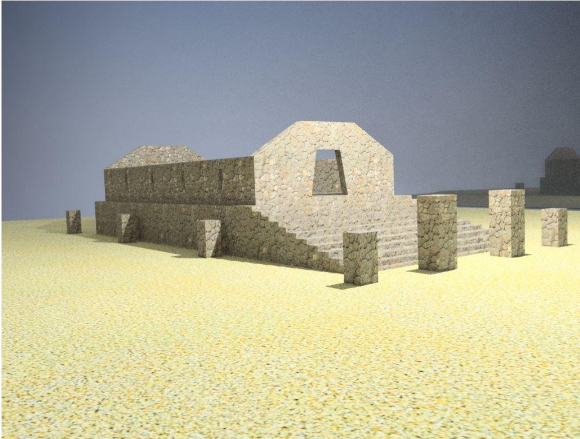
Imagen Digitalizada del templo Yavirac

Los templos Incas eran de piedra talladas en varios ángulos, con gradas de doce columnas. Como se muestra en la representación esquemática realizada en el programa Sketch Up.