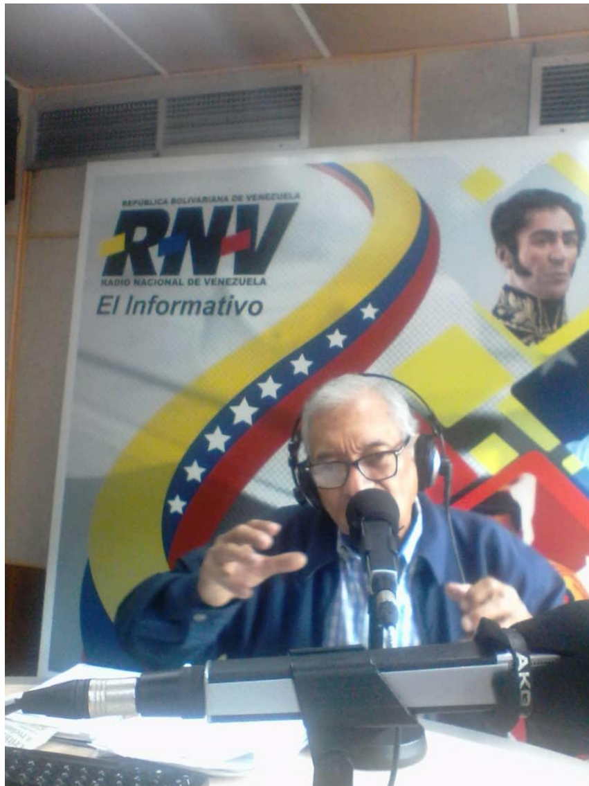
Fotografía 1. El informante durante su Programa en Radio Nacional de Venezuela “La Voz del Adulto Mayor” (2019).