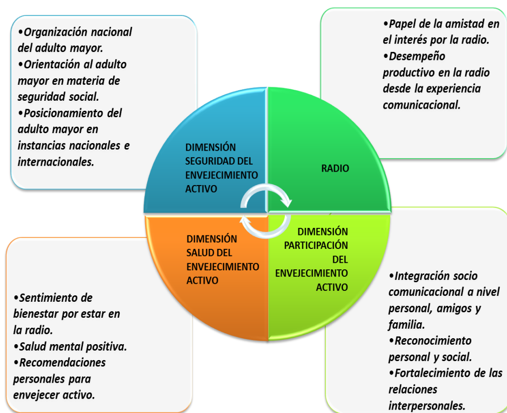
Figura 3. Resultado de la entrevista aplicada al informante clave (2022)

Tal como se conoció, el propósito de este estudio de caso fue mostrar la experiencia de un adulto mayor en la radio como medio de comunicación social para un envejecimiento activo; por eso, una vez analizada la información desde la categorización y subcategorización y posterior proceso de hermenéutica de enunciados a continuación se muestra de forma gráfica los resultados por cada categoría emergente: