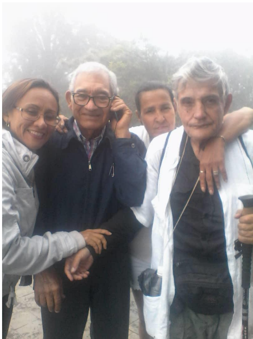
Fotografía 2. El informante y la investigadora junto a dos amistades durante caminata a Cerro Avila. Guaraira Repano. Distrito Capital. (2019)

Experiencia de envejecimiento activo de un adulto mayor