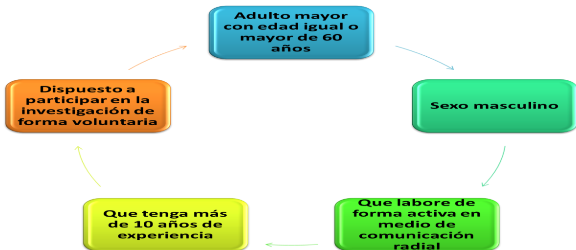
Figura 2. Criterios de selección del informante.

Para la selección del informante, se consideraron los siguientes criterios de selección (ver figura 2):